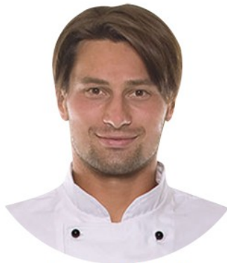
Lionel RIMET Fondateur